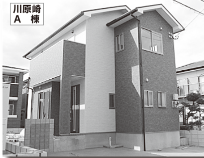
川原崎 A 棟