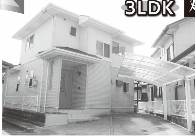
○ 2020年1月まで1kWh/48円で売電出来ます ○