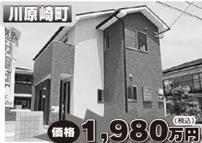
価格 1,980万円 (税込)